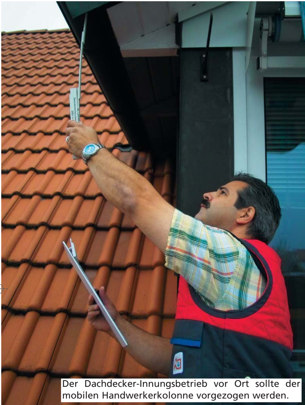
Der Dachdecker-Innungsbetrieb vor Ort sollte der mobilen Handwerkerkolonne vorgezogen werden.

Der Dachdecker in der Nähe bietet dem Auftraggeber viele Vorteile